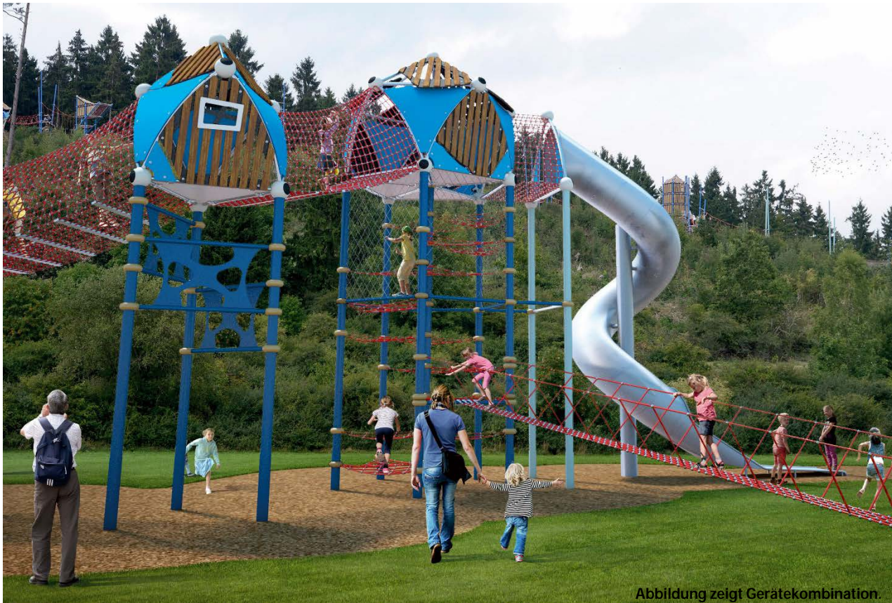
Abbildung zeigt Gerätekombination.