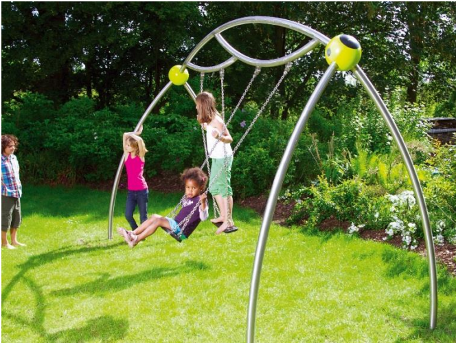
Swingo.2.2 Die zweiseitige Version der Swingos ist asymmetrisch und doch können Zwei in Harmonie zusammen schaukeln.